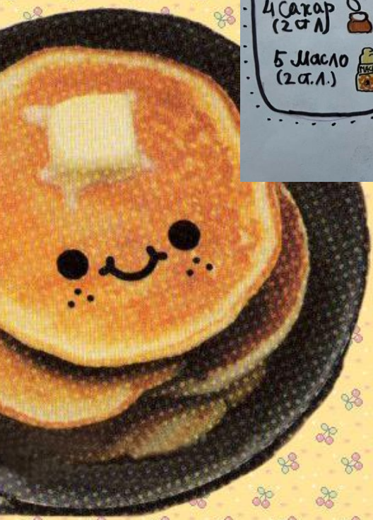
БЛИНЧИКИ от Марка К.